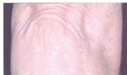
After 4 weeks treatment with Daivobet twice daily